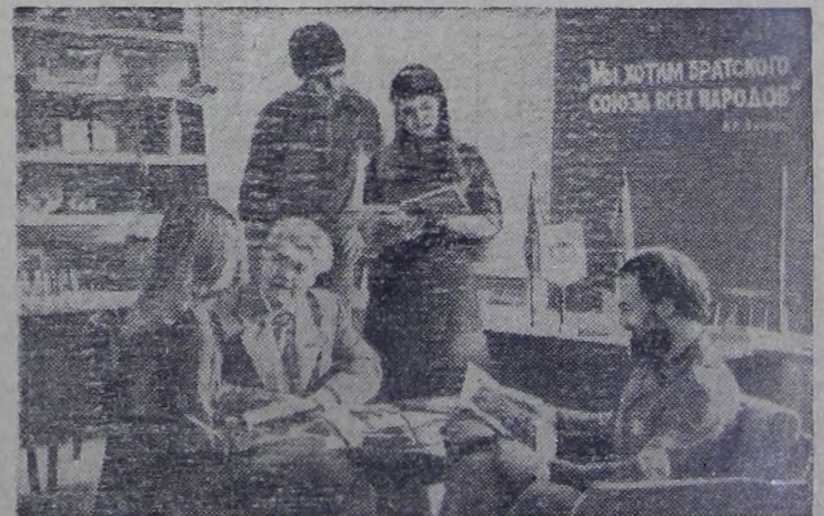
— заведующий кафедрой по новейшей истории Кипиневского государственного университета имени В. И. Ле-

Мои планы на будущее — дать до конца пятилетки еще два годовых плана и надеюсь, что мои товарищи по работе меня в этом поддержат.