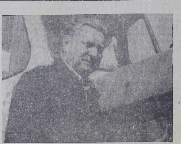
годы и люди В строю — гвардейцы