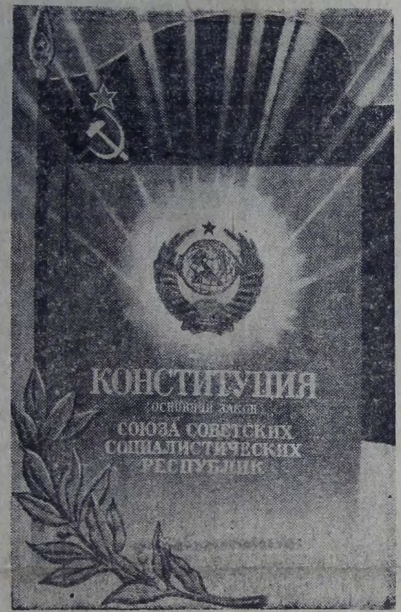
Плакат художника Л. Тарасовой. Издательство «Плакат». Фотохроника ТАСС

7 октября — День Конституции СССР С ПРАЗДНИКОМ, ТОВАРИЩИ!