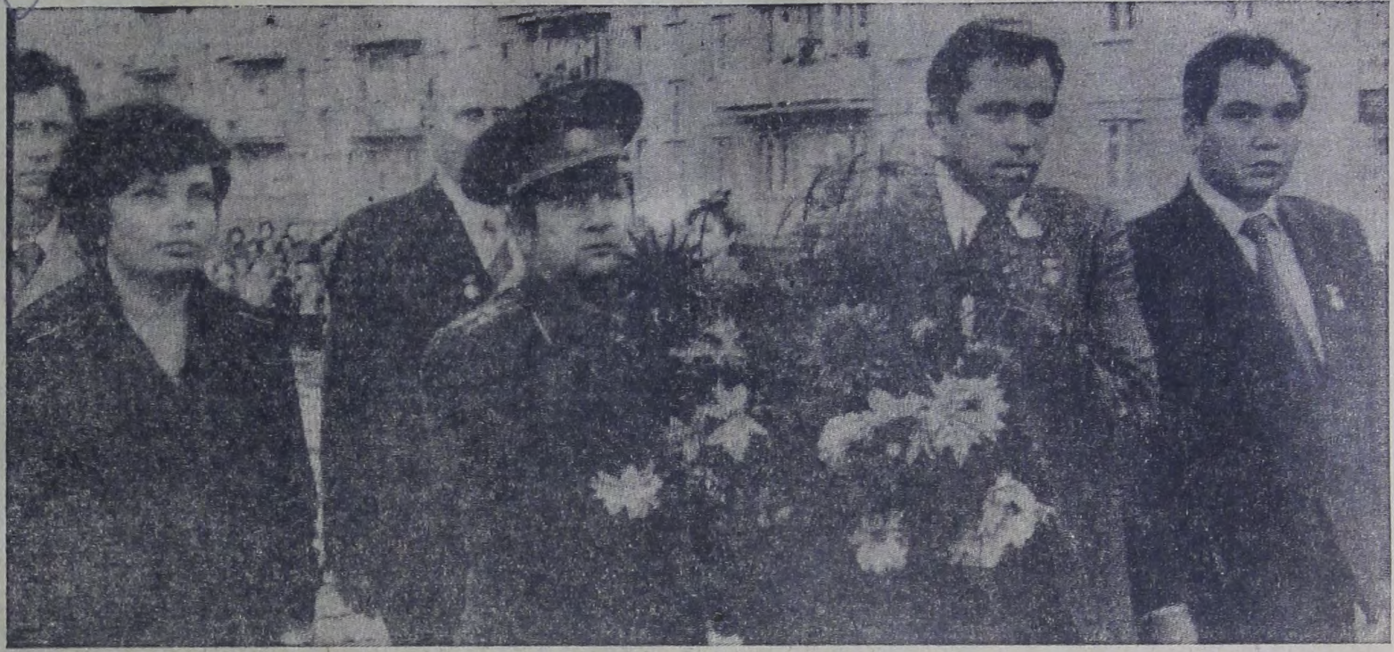
На снимке: возложение цветов к обелиску памяти балаковцев, погибших в годы Великой Отечественной войны.

М. МИТРИШКИН, старший инженер производственно-технического отдела ТЭЦ-4.