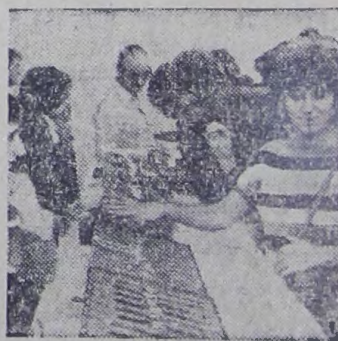
На верхнем снимке: в торговом центре общества в городе Безансоне, где продаются советские часы.

На нижнем снимке: здание торгово-технического центра фирмы «Слава» в городе Безансоне.