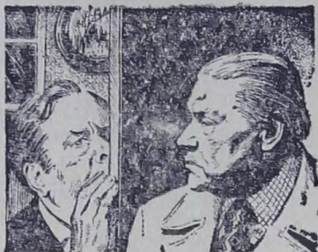
ВЕРСИЯ ПОЛКОВНИКА ЗОРИНА

Репертуар сентября составлен с учетом самых разнообразных зрительских интересов. Здесь и фильмы современной тематики, и детектив, и кинокомедия.