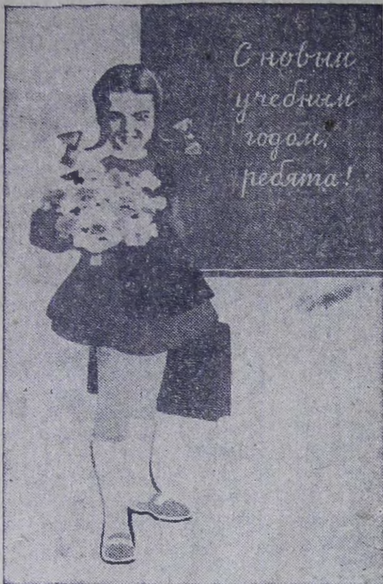
Плакат художника С. Кочанова. Издательство «Плаката».