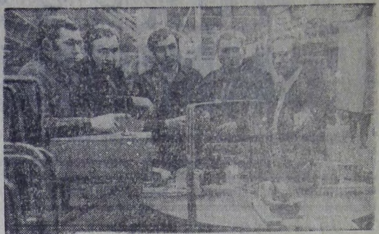
«Вести в действие Камский комплекс заводов по производству большегрузных автомобилей». («Основные направления развития народного хозяйства СССР на 1976—1980 годы»).

Набережные Челны (Татарская АССР). Уверенно набирают мощность заводы первой очереди Камского объединения по производству большегрузных автомобилей, самого молодого в отрасли.