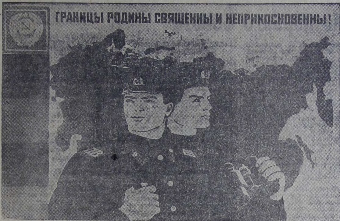
ГРАНИЦЫ РОДИНЫ СВЯЩЕННЫ И НЕПРИКОСНОВЕННЫ!