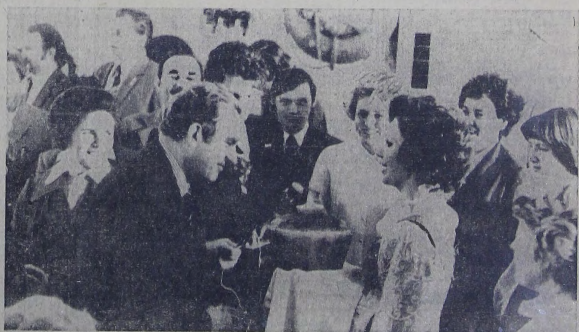
Тепло встречали представители общественности города пассажиров теплохода «Козьма Минин» — писателей Москвы, Ленинграда, Орла, Калинин, Горького, Воронежа, союзных республик.