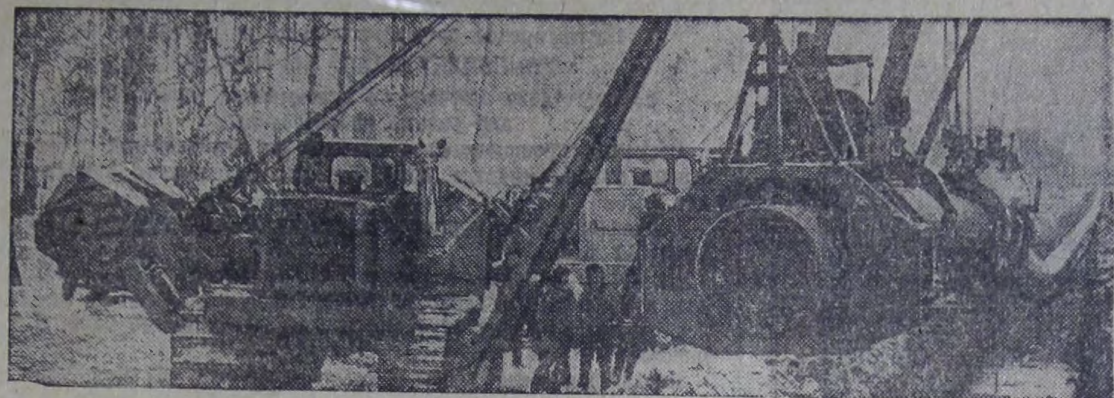
На строительстве газопровода Уренгой — Челябинск

Тюменская область. Близятся к завершению основные работы на строительстве первой очереди трубопровода Уренгой — Челябинск. Трасса берет начало от Вынгапурского месторождения природного газа на севере Тюменской области. Ее протяженность почти 1400 километров. В эти дни строители штурмуют болота, сооружают переходы через многочисленные сибирские реки и