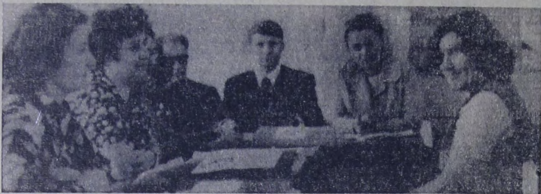
Успешно проходит аттестация учителей в средней школе № 6.

○ ИДЕТ АТТЕСТАЦИЯ УЧИТЕЛЕЙ ○ ВРАЧ ПО ПРОФЕССИИ И ПО ПРИЗВАНИЮ ○ ПУТЕШЕСТВИЕ В МИР СКАЗОК ○ ТВОРЧЕСКИЙ ОТЧЕТ ПЕРЕД ЗРИТЕЛЕМ ○