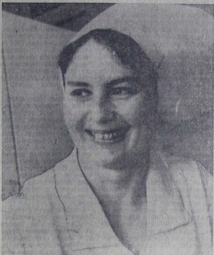
деленное время распахиваются перед посетителями двери столовой. Люди знают, что их ждут приветливые улыбки обслуживающего персонала. Разнообразно меню. На выбор мясные, молочные и овощные блюда, блюда из рыбы.