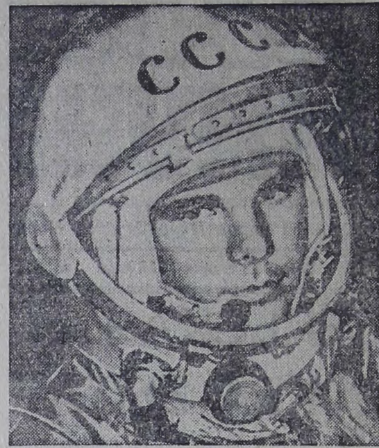
На снимке: летчик-космонавт СССР Юрий Алексеевич Гагарин перед полетом в космос 1961 год.