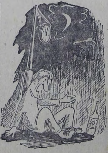
—Ты только одна, ты одна виновата, что я до сих пор не женат! Рис. С. Ростова.

Балаковское полиграфобъединение «Авангард» управления издательств, полиграфия и книжной торговлей Саратовского облисполкома. Адрес: г. Балаково, ул. Свердлова, 69. Заказ № 49.