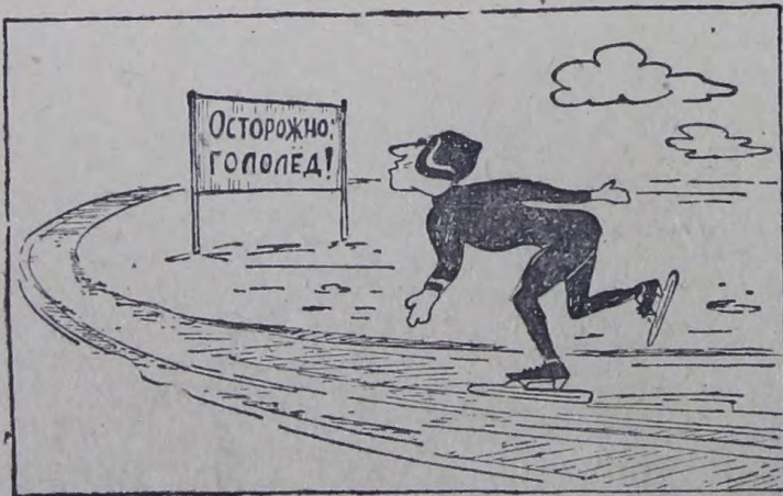
Рисунок С. Растова.