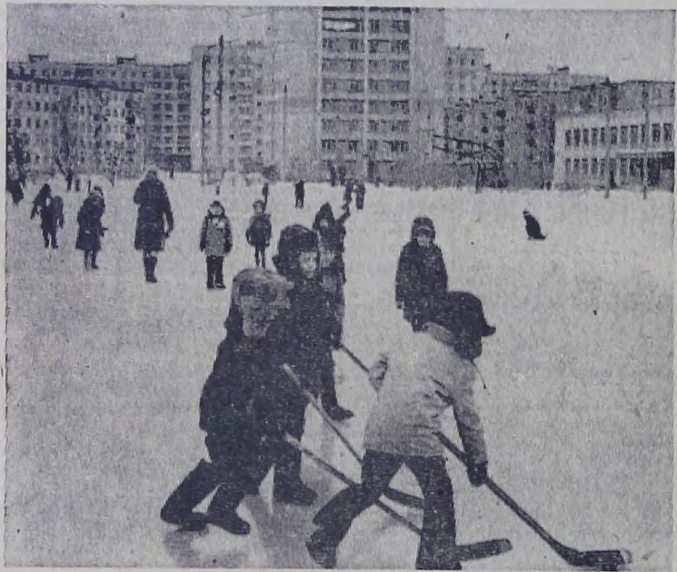
Хоккейные батальоны на последнем льду.