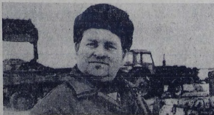
В колхозе им. Дзержинского осуществляется планомерная вывозка органических удобрений на орошаемые поля.

И конечно же, все население села в день субботника примет активное участие в благоустройстве: в очистке улиц и дворов, озеленении, ремонте палисадников, побелке штамбов.