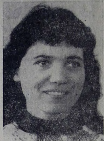
контролируем работу всех молодых специалистов.

Да, праздники — хорошо, только и дело есть дело. В эти дни самая пора быть готовым во всеоружии встретить весну. И комплектом комсомольско-молодежные агрегаты механизаторов,