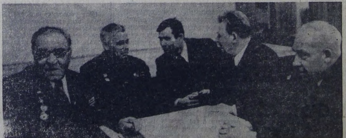
Группа активистов печати перед началом торжественного собрания, посвященного 60-летию газеты.

Газета «Огни коммунизма» начала отчет нового седьмого десятилетия. В своем обращении ко всем рабселькорам участники торжественного собрания, провозгласили свою главную задачу — быть активными помощниками партийных организаций в благородном деле выполнения исторических предначертаний XXV съезда КПСС.