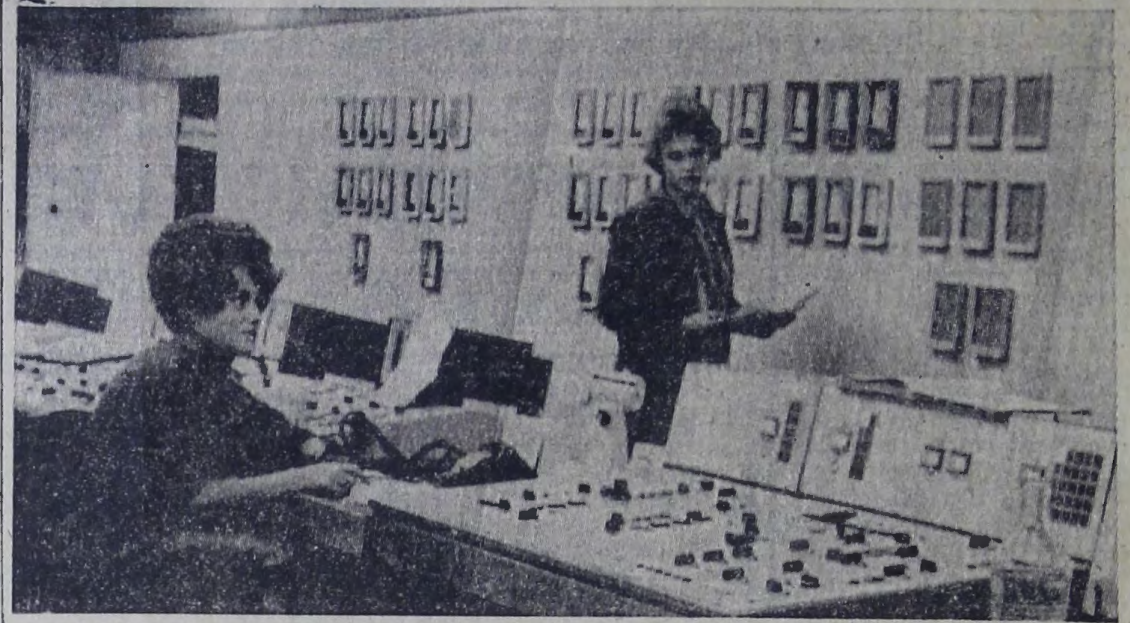
Из года в год подтверждают звание коллектива коммунистического труда работники целлофанового производства объединения «Химволокно» имени Б. И. Ленина. Здесь высока культура труда, повсюду внедряется автоматика, совершенствуется процесс производства. Не случайно план трех лет пятилетки коллективом выполнен досрочно, 26 сентября.

На снимке: пульт управления технологическим процессом целлофанового производства.