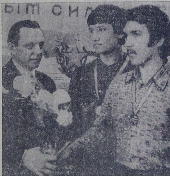
Посвящение в рабочий класс на заводе запасных деталей стало доброй традицией. Оно проходит в торжественной обстановке и остается в памяти на всю жизнь. В этот день молодежи высказывают пожелания, дают напутствия рабочие, администрация, представители общественных организаций. Желают ей с честью нести по жизни гордое имя рабочего человека.