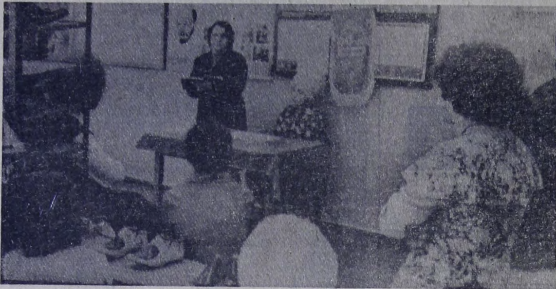
Коллектив цеха № 1 фабрики ремонта и пошива обуви досрочно завершил производственную программу прошлого года, успешно начал третий год десятой пятилетки. Обувщики горячо откликнулись на Письмо ЦК КПСС, Совета Министров СССР, ВЦСПС и ЦК ВЛКСМ к советскому народу. На состоявшемся митинге его

участники в ответ на призыв партии ипре вернуть соревнование в нынешнем году решили трехлетнее задание завершить к первой годовщине Конституции СССР.