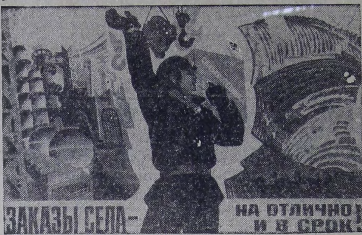
Плакат художника Ю. Голубева «Заказы села — на отлично и в срок!». Издательство «Плакат».

В. КАЗАНОВ, редактор многотиражной газеты «Слава труду».