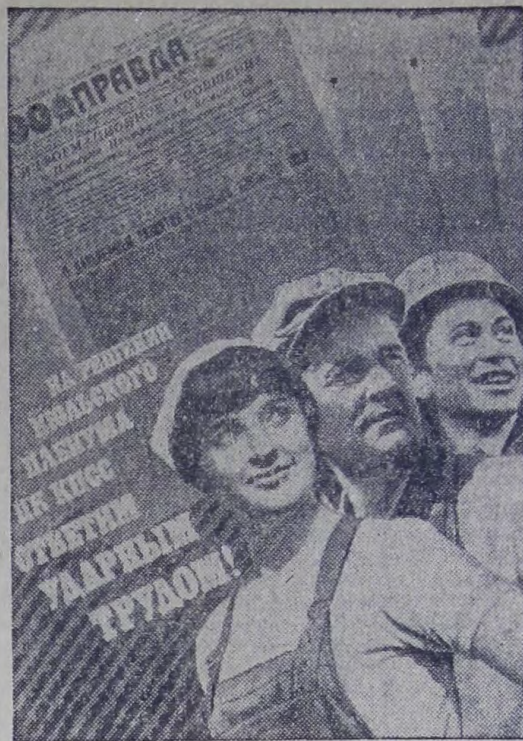
★ Плакат художника Л. Тарасовой. Издательство «Плакат».

В. УВАРОВ, первый секретарь райкома КПСС. А. НИКИТИН, председатель райисполкома. В. ЧУЛАНОВ, председатель райкома профсоюза. В. РОГОВ, первый секретарь райкома ВЛКСМ.