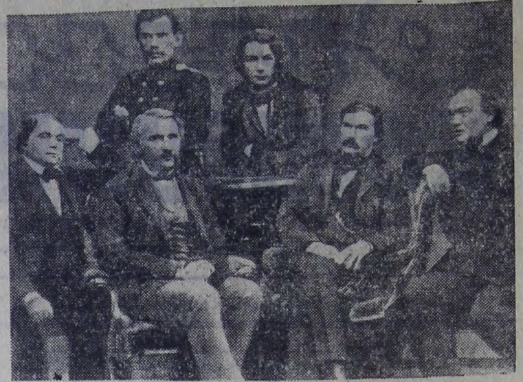
Группа сотрудников журнала «Современник» (1856 г.). Сидят (слева направо) Гончаров, Тургенев, Дружинин, Островский. Стоят — Толстой и Григорович.