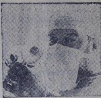
искусственное сердце — детище пелого коллектива конструкторов, биологов, физиков...