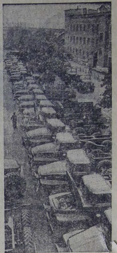
Челябинская область. Более 80 процентов автомобилей Уральского автозавода в Миассе выпускаются с государственным Знаком качества.

На заводе введен в действие новый цех консервации и комплектации запасных частей. Все процессы здесь механизированы и автоматизированы. Для хранения готовой продукции построены высотные склады.