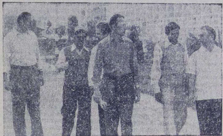
Важную роль в отношениях СССР и Индии занимает экономическое сотрудничество. При содействии Советского Союза в стране построены или строятся десятки промышленных предприятий. На снимках: группа советских и индийских специалистов на территории завода тяжелого электрооборудования в Хардваре, построенном при техническом и экономическом содействии СССР; памятник Д. Неру на территории завода.