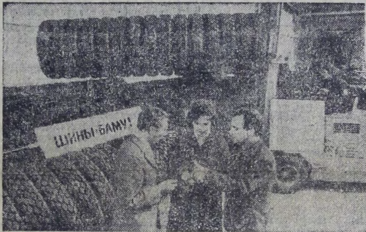
Киевская область. Две тысячи грузовых автомобилей для БАМа «обули» выпускной сверх плана с начала года продукцией с государственным знаком качества производственники Белоцерковского шинного завода.