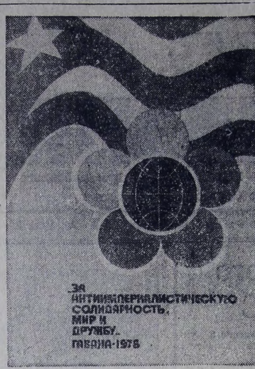
★ Плакат художников В. Васина, Е. Васильева и В. Цыганкова «За антиимпериалистическую солидарность, мир и дружбу», посвященный XI Всемирному фестивалю молодежи и студентов в Гаване. «Издательство «Плакат».