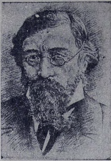
На снимке: Н. Г. Чернышевский (с гравюры).

21 июля исполняется 150 лет со дня рождения Николая Гавриловича Чернышевского (1828—1889). Жизненный подвиг великого русского революционного демократа, выдающегося ученого, глубокого мыслителя-материалиста, блестящего писателя и литературного критика навсегда вошел в историю России. Его деятельность, пронизанная ненавистью к крепостничеству и самодержавию, была посвящена защите угнетенного народа и составила эпоху в истории русского освободительного движения, истории русской науки и культуры. Признанный глава революционных демократов, он оказал огромное влияние не только на передовых людей России своего времени, но и на последующие поколения революционеров.