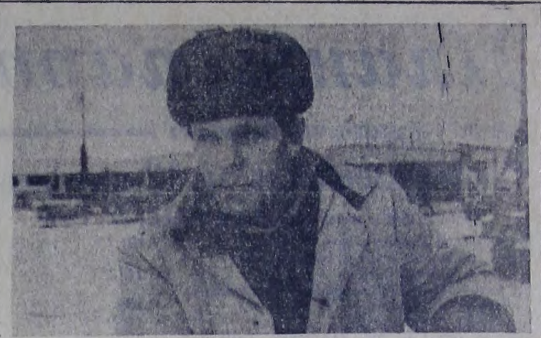
Гвардейцы десятой пятилетки

В редакции районной газеты «За победу коммунизма» создан внештатный отдел по освещению в печати трудовой вахты животноводов. На фермах организованы корреспондентские посты. Организуем семинар и окажем необходимую помощь редколлегам