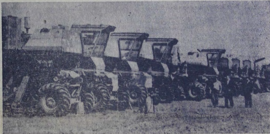
На стройке химического завода