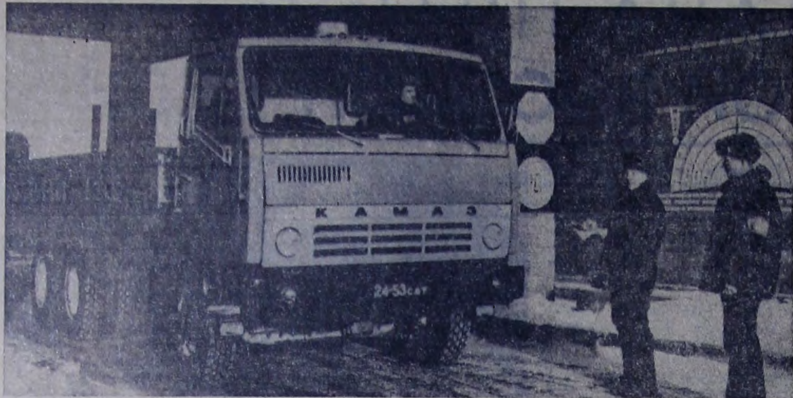
Районное автохозяйство «Трансельхозтехника» пополнилось новыми автомашинками. Получено пять первых КамАЗов. Ими управляют самые опытные шоферы. На снимке: КамАЗ отправляется в первый рейс.