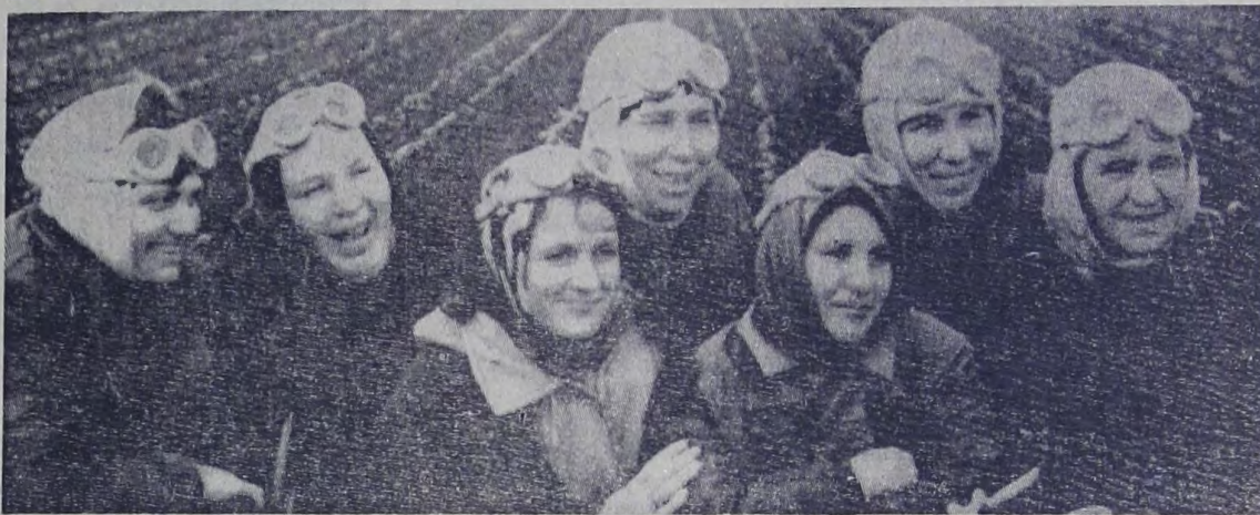
На орошаемом участке совхоза «Волгарь» работа в разгаре. Овощеводы хозяйства, готовя достойную встречу 60-летию Великого Октября, широко развернули социалистическое соревнование, добиваясь значительного перевыполнения за-