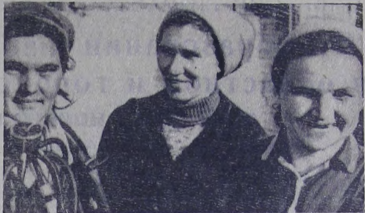
В соревновании между коллективами молочно-товарной фермы колхоза им. Свердлова первое место занял коллектив 4-го корпуса фермы