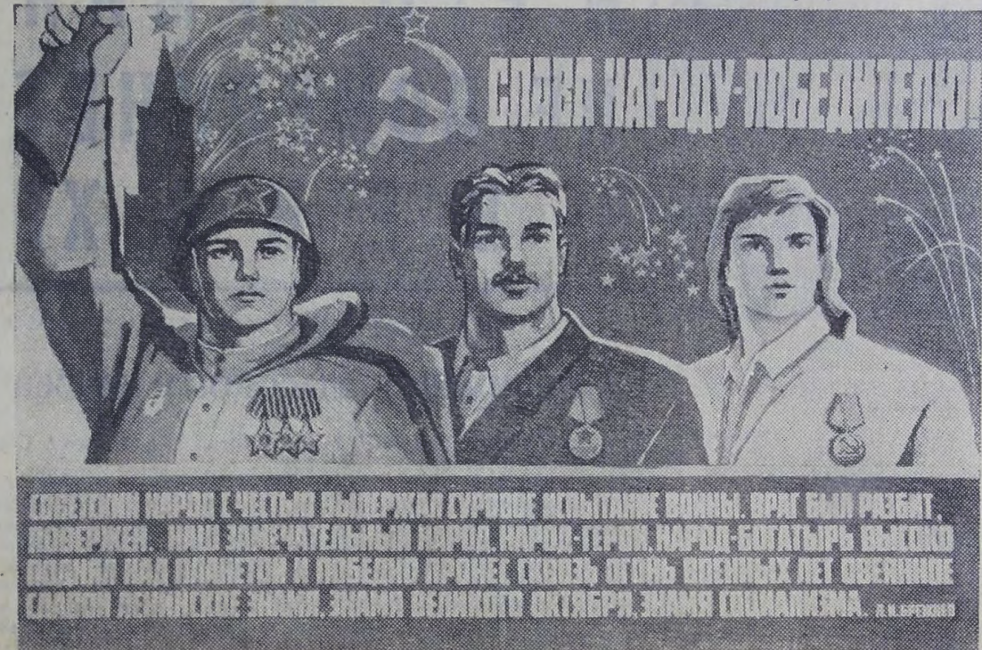
Плакат художника И. Мальта «Слава народу-победителю». Издательство «Плакат».