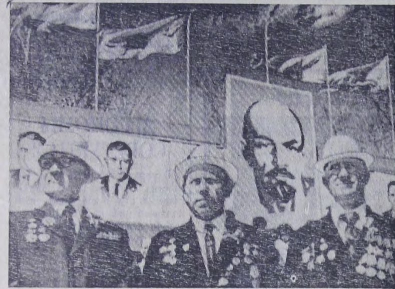
Ветераны партии, революции, гражданской и Великой Отечественной войн и труда. Особую боевую закалку, суровую школу борьбы прошло это поколение. И чем больше отдаются те тяжелые и суровые годы, тем явственнее предстает перед каждым из нас значение и величие подвига, совершенного этим поколением.