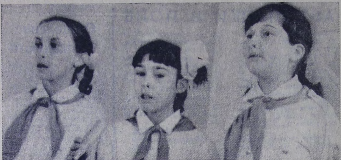
В средней школе № 16 учащиеся с увлечением занимаются в кружках художественной самодеятельности.