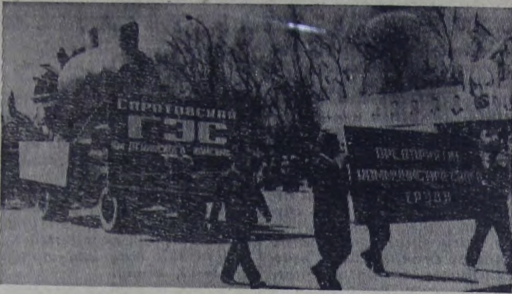
1 Мая. Праздничная колонна демонстрантов на площади Балаково.