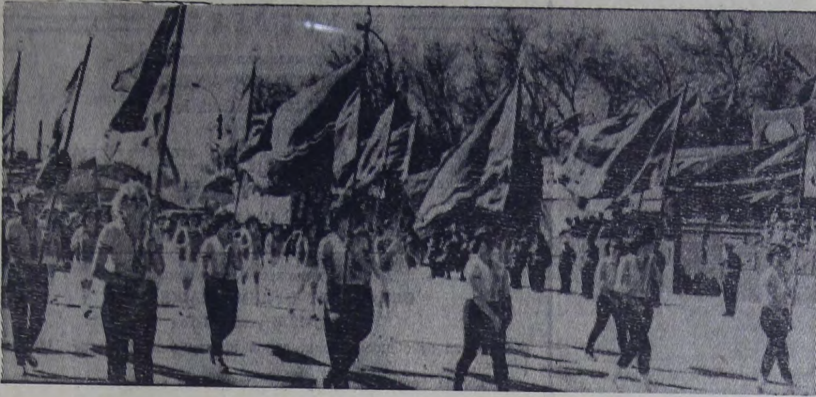
Колонна демонстрантов на праздновании 1 Мая в Балакове.