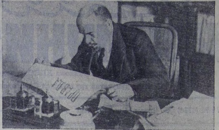
В. И. Ленин в рабочем кабинете в Кремле. Москва, октябрь 1918 года.