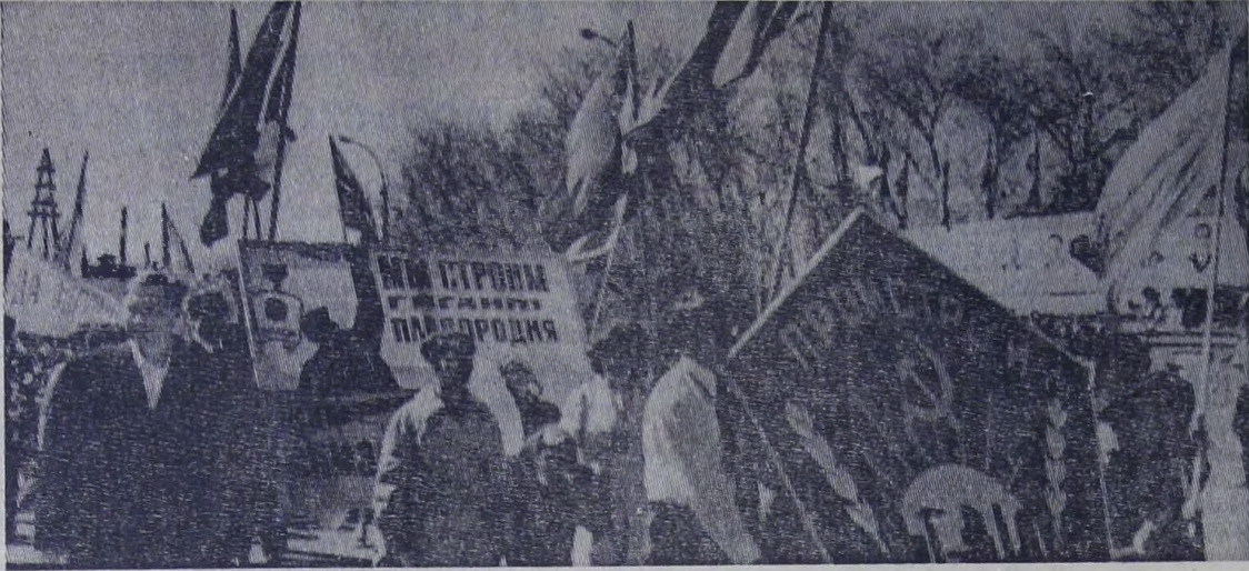
Праздничные колонны демонстрантов 1 Мая.