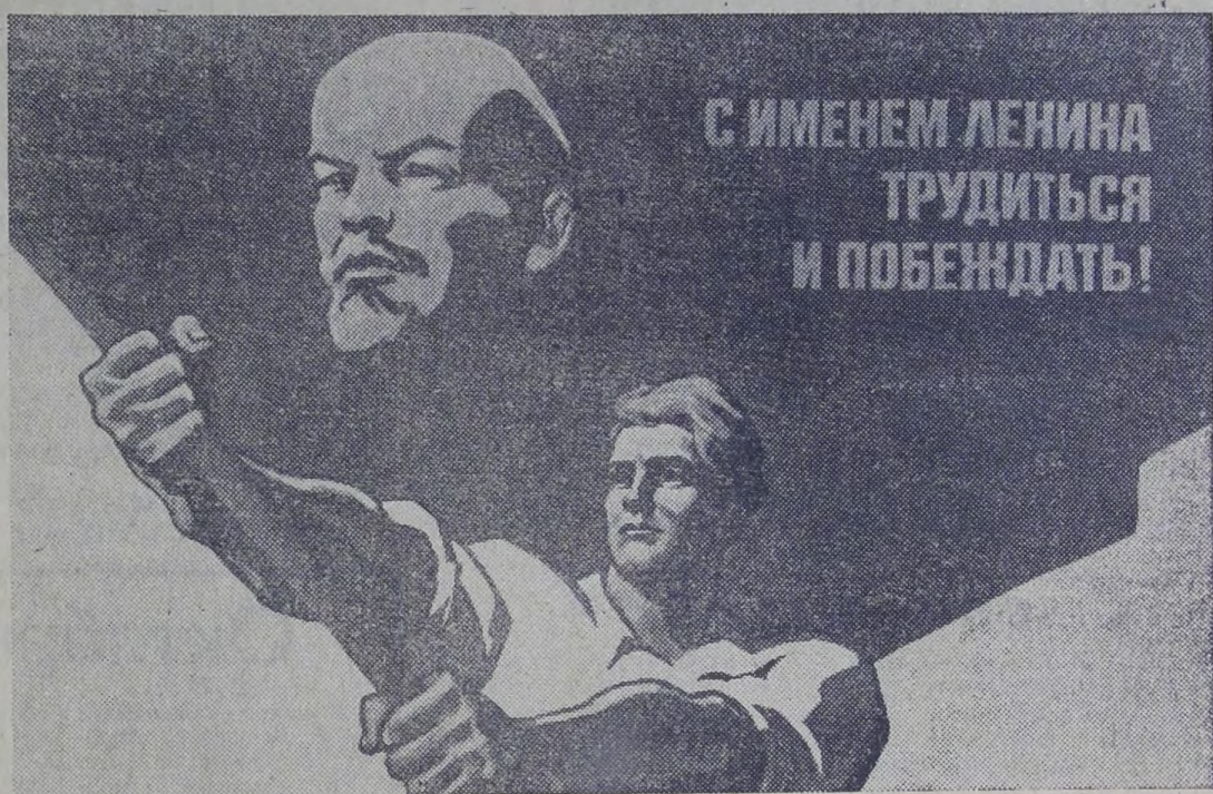
Плакат художников А. Тондзе и И. Тондзе. Издательство «Плакат».

Каждая годовщина со дня рождения Ленина становится великим интернациональным праздником людей труда и науки, боевым смотрам революционных сил, достижений социализма.