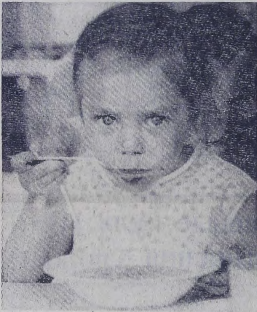
«ВКУСНО!». Детсад 4 б микрорайона.