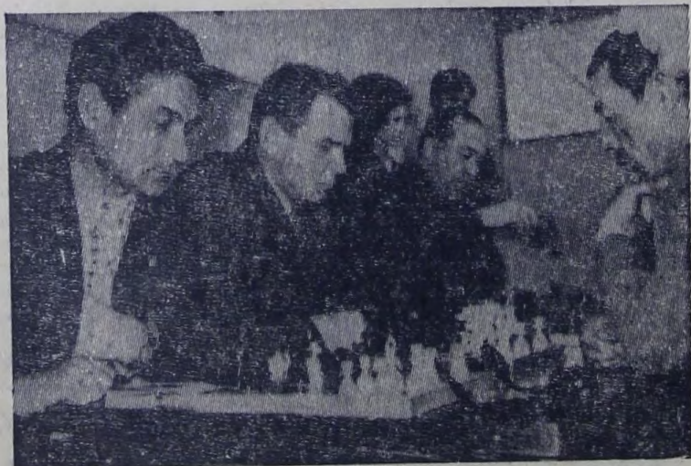
службы Саратовгэстроя, внештатный корреспондент редакции газеты «Огни коммунизма».