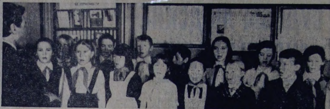
Учащиеся Маянгской школы частые гости на молочно-варной ферме. Они выступают перед животноводами с песнями и стихами, доставляя им радость.