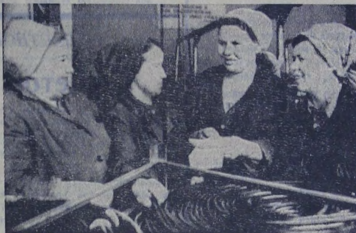
Смена коммунистического труда оплетчиц цеха № 3 завода резиновых технических изделий им. 50-летия СССР программы второго года десятилетия намерена заер...