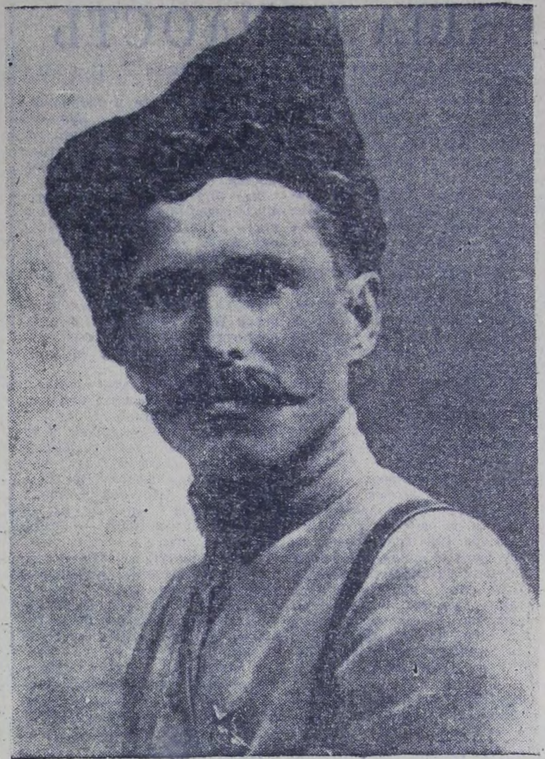
В. И. Чапаев.