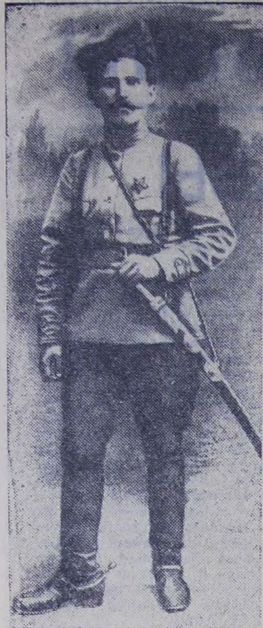
На снимке: В. И. Чапаев.