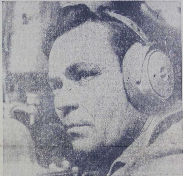
Гвардейцы десятой пятилетки