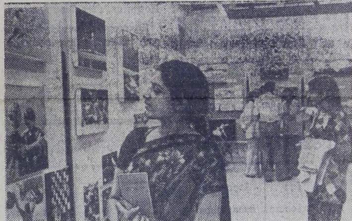
«СССР — страна мира и созидания». Так называется фотовыставка ТАСС, демонстрирующая в Дели. Она проводится в рамках фестиваля советской культуры и искусства в Индии, посвященного 60-летию Великого Октября.