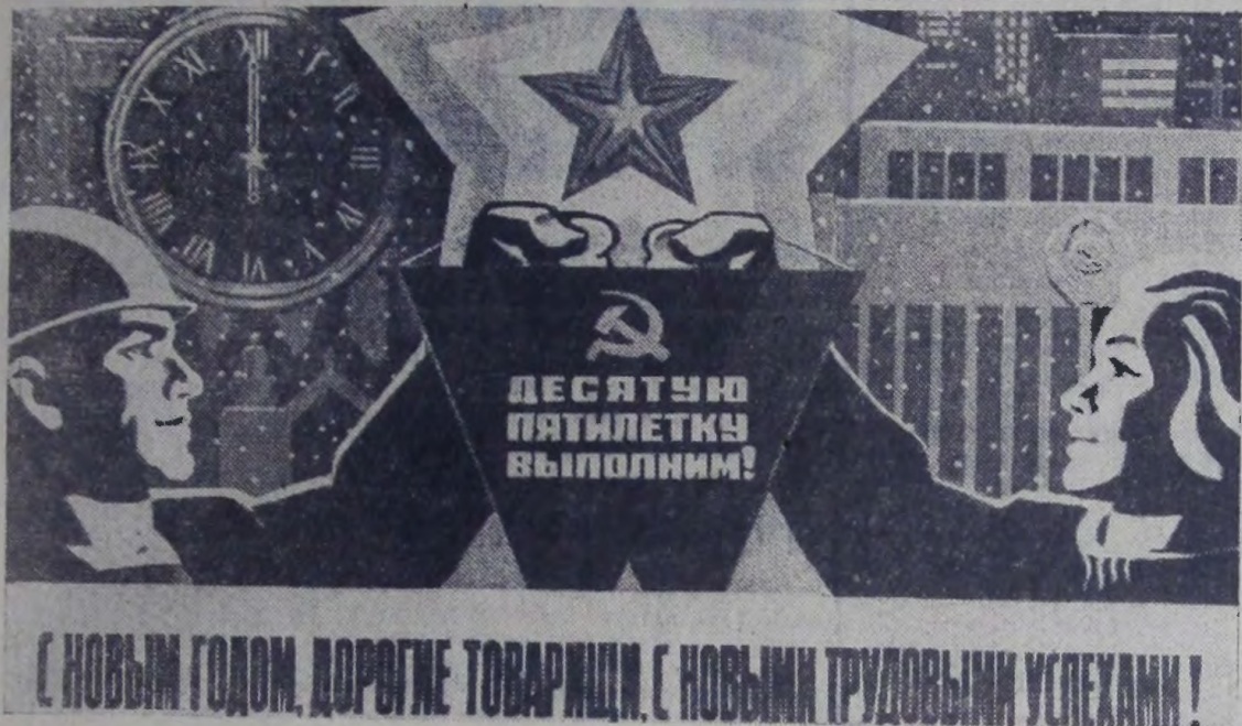
Плакат художника И. Комина. Издательство «Плакат».

№ 1 (8297) ♦ Суббота, 1 января 1977 года ♦ Год издания 60-й ♦ Цена 2 коп.