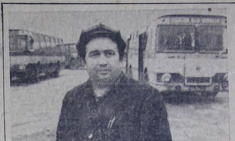
Победитель в социалистическом соревновании за

№ 189 (8485) ♦ Вторник, 29 ноября 1977 года ♦ Год издания 60-й ♦ Цена 2 коп.