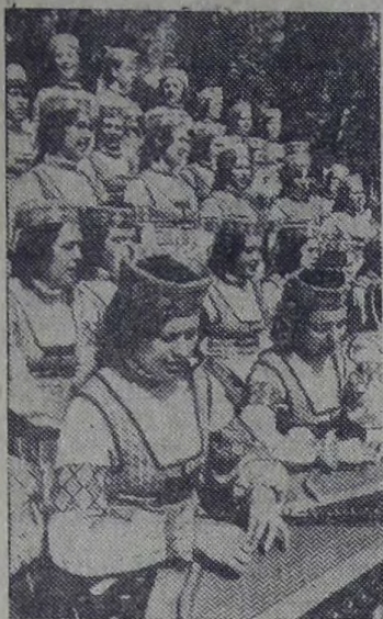
Литовская ССР. Искусство заслуженного народного ансамбля песни и танца Каунасского политехнического института «Ня-