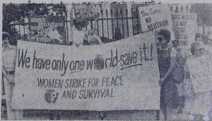
Американские планы производства смертоносного нейтронного оружия вызывают протест прогрессивной общественности всех стран. «У нас только одна земной шар — спасите его!» — с этим плакатом-призывом пришла к Белому дому в Вашингтоне делегация женщин.