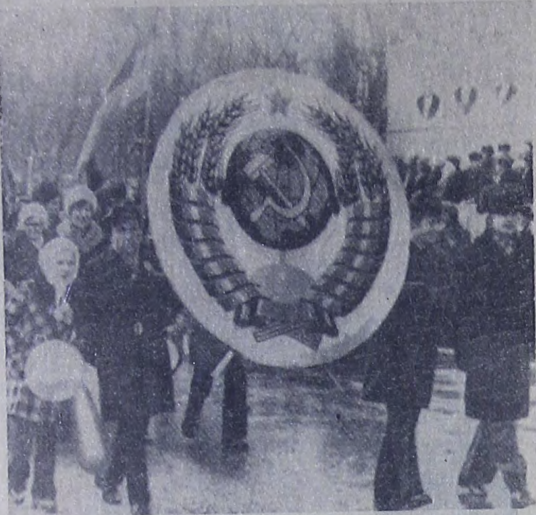
Праздничная демонстрация трудящихся Балакова 7 ноября 1977 года.