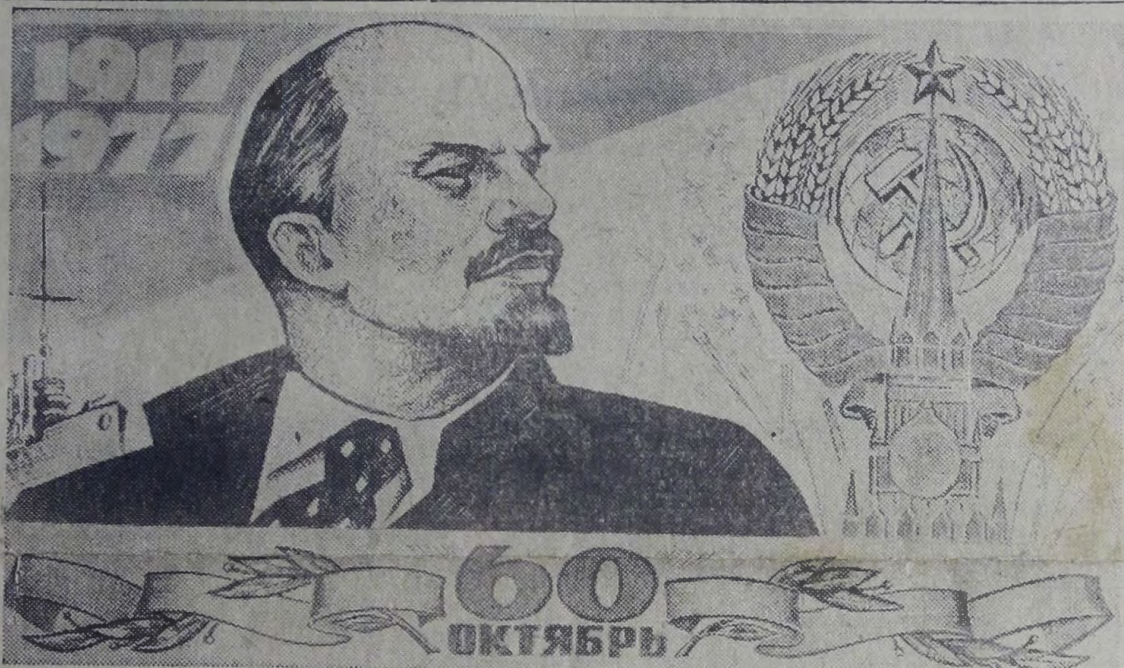
Плакат издательства «Московская правда».

№ 177 (8473) ◆ Понедельник, 7 ноября 1977 года ◆ Год издания 60-й ◆ Цена 2 коп.