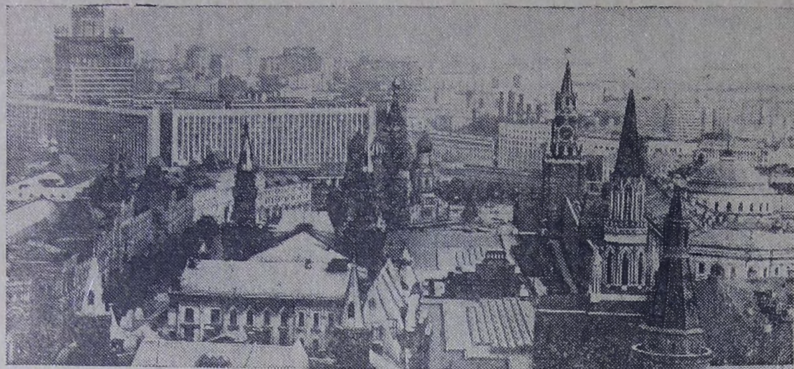
Москва. На снимке: вид на Кремль, Красную площадь и гостиницу «Россия».